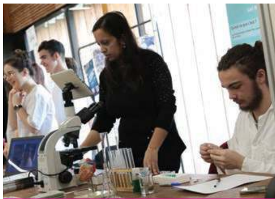
►► Les démonstrations des étudiants dans les filières scientifiques.