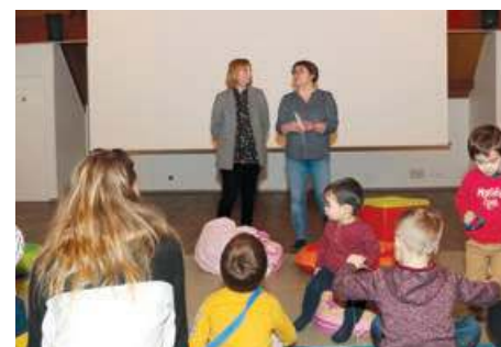
A l'heure du palmarès, samedi 7 mars, au Centre des arts et loisirs.