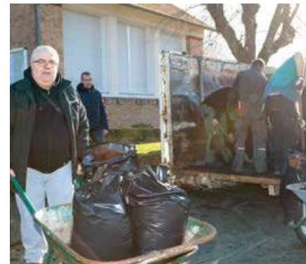
►► Dix tonnes de compost ont été distribuées aux Buchelois, devant la Mairie, samedi 7 mars.