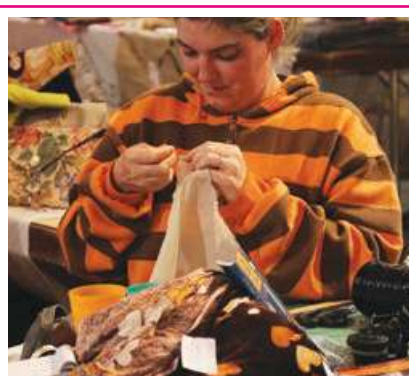
►► Les passionnées ne s'interrompent pas.