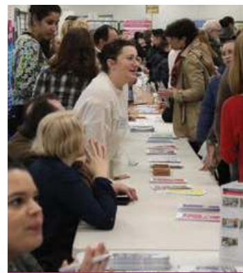
►► Un temps pour répondre aux questions des élèves et de leurs parents.