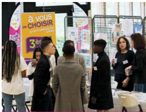
►► Salon des formations, à quelques minutes de l'ouverture des portes au public.

C'était avant la crise sanitaire liée au coronavirus et les mesures de confinement : la 4 e édition du Salon des formations après la classe de 3 e , Plaine des Sports Grigore-Obreja, la distribution de compost aux Buchelois et les premières Puces des couturières, proposées par l'association L'idée à coudre. Rétrospective en images.