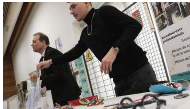
►► De nouvelles formations ont étoffé le salon annuel.