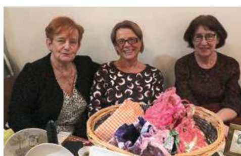
►► La première édition a réuni une trentaine d'exposants et quelque 200 visiteurs.

Suivez aussi l'actualité de Buchelay sur les réseaux sociaux !