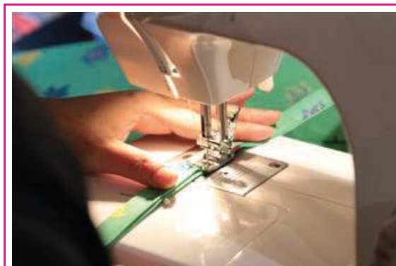
►► Une petite démonstration de savoir-faire, aux Puces des couturières, dimanche 1 er mars.