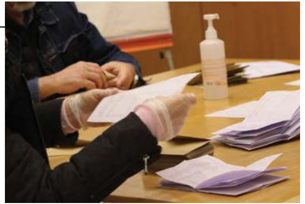
A l'heure du dépouillement, dimanche 15 mars.