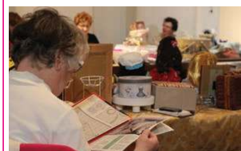
►► Aux puces des couturières, on trouve aussi d'anciens magazines spécialisés.